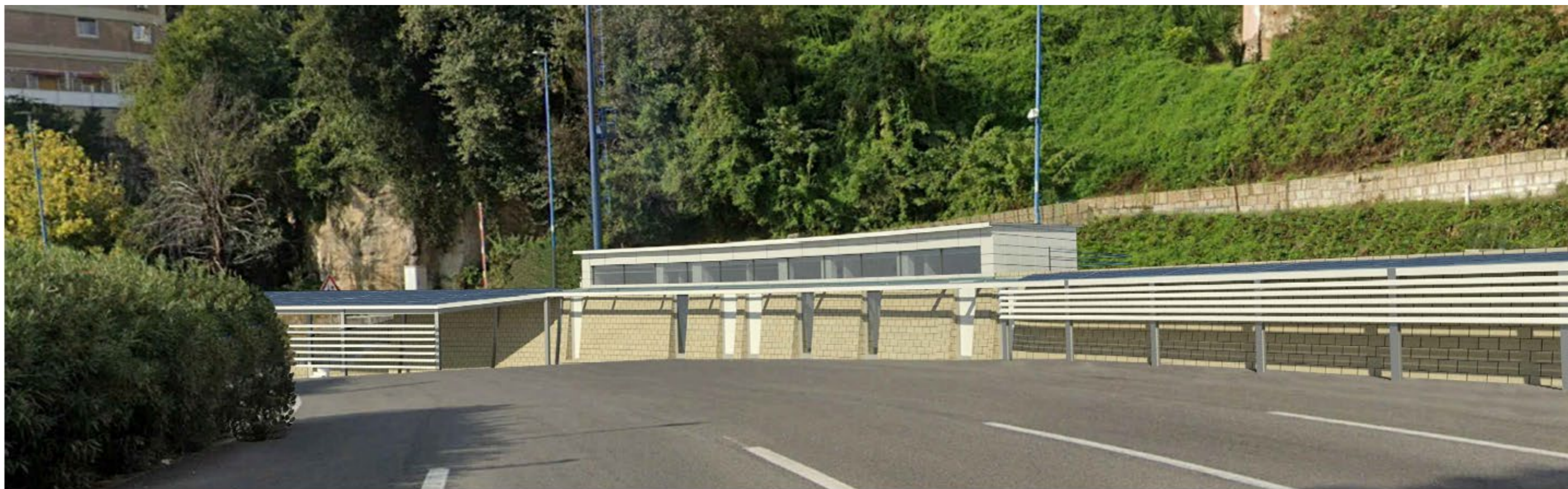
Fotoinserimento post intervento