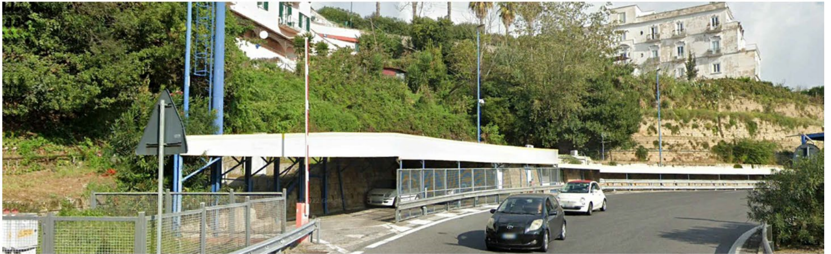
Fotoinserimento ante intervento