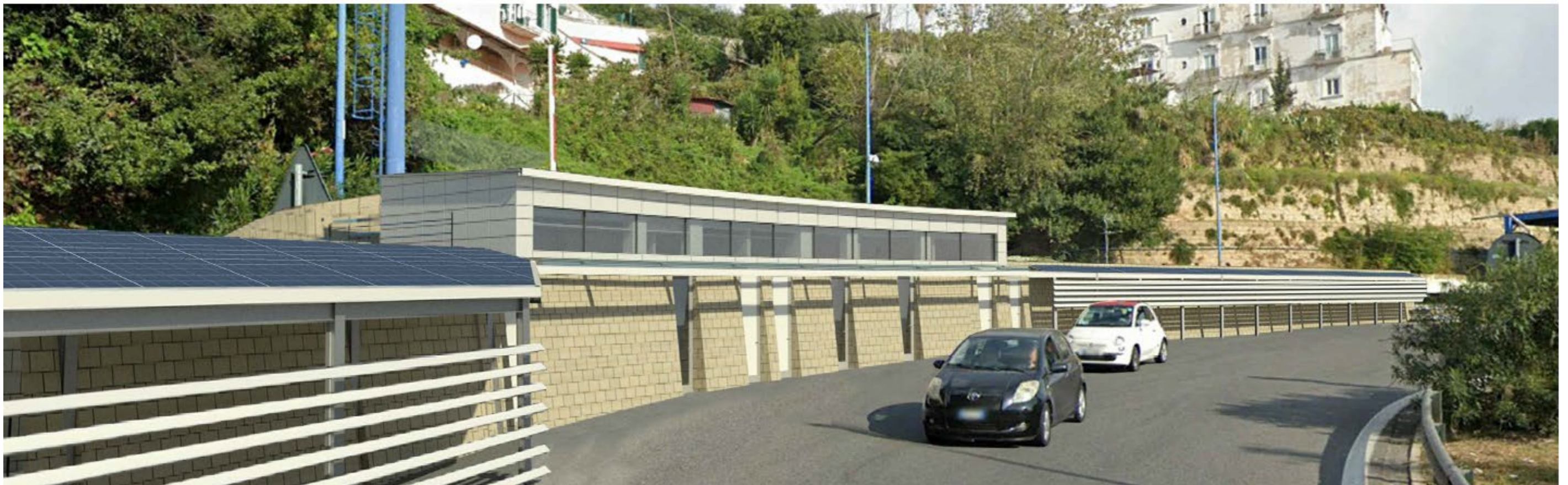
Fotoinserimento post intervento