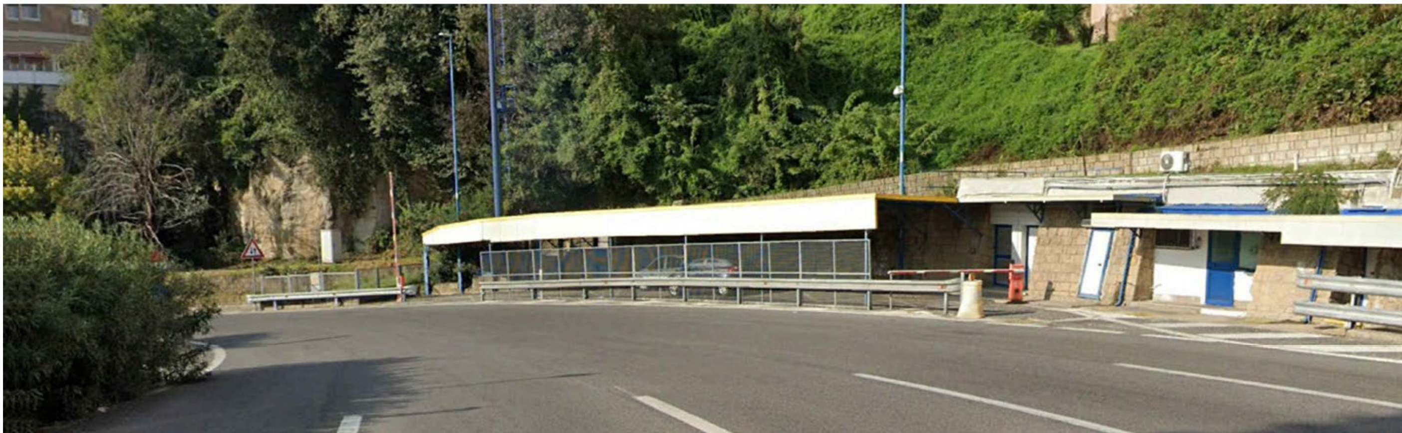
Fotoinserimento ante intervento